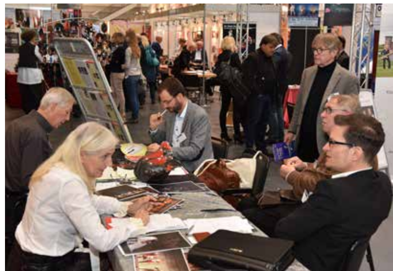
Der INTHEGA-Theatermarkt: Anbieter im Gespräch mit Interessenten

im Herbst ist die Leitmesse für deutschsprachiges Tournée-theater und bietet rund 170 Ausstellern aller Sparten sowie Anbietern u.a. aus den Bereichen Ticketing, Software und Technik eine Plattform, auf die eigenen Angebote aufmerksam zu machen. Im Rahmen dieser Veranstaltung zeichnet die INTHEGA drei herausragende Produktionen der jeweiligen Spielzeit aus (INTHEGA-Preis „Die Neuberin“).